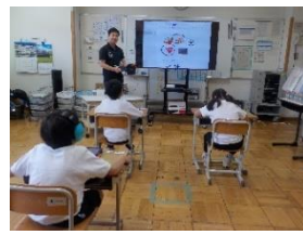
II小5年 国語・算数での学習の様子