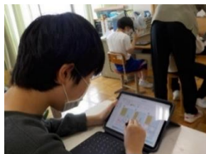
II中3年 国語・数学での学習の様子

このように、デジタルの「即時性」とリアル「寄り添い」を組み合わせることで、より質の高い学びの実現につなげています。