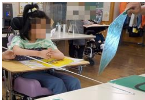
↑ 実習先の支援員さんと活動中