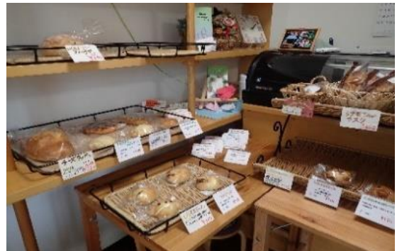
パン工房うさぎとかめ(八王子市大塚 422-3)