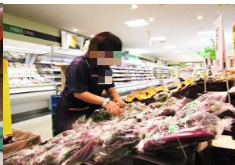
↑ 袋詰めした商品を品出し