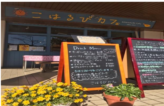
どんぐりパン「こはるび Cafe」(多摩市落合 6-1-1-105)

コロナ禍でも頑張ってきた事業所のお店。パンやお菓子、自家製野菜、惣菜、軽食のできるカフェ、うどん屋、カレー屋、駄菓子、古本、リサイクル、自然食品、工芸品など素敵なお店があります。「福祉事業所の紹介」冊子の事業所が運営しているところも多く、身近な存在です。