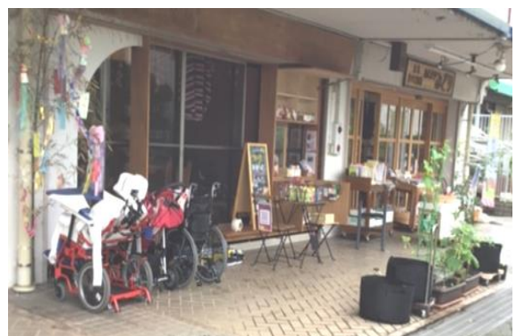
アンドラフ(駄菓子屋 多摩市諏訪 5-6-3)

この他にもたくさんあります。たとえば、学校近く聖ヶ丘商店街、Ⅱ高のさくら運送でおなじみのスーパービッグエー向かい「多摩うどんぼんぼこ」は多摩市落合のぐりーんぴーす工房のお店。グルメ雑誌で紹介されたこともあります。障害のある方々がいきいきと働きお客様の声に応えることで地域に貢献し、やがてお店がそこに無くてはならない存在になる。コロナ禍が少し鎮まった今、そうしたお店が増えています。笑顔で接客、活躍している卒業生に出会えるかもしれません。