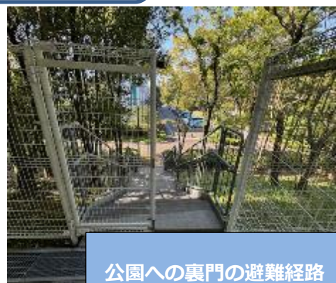
公園への裏門の避難経路

予定されていた火災を想定した大谷戸公園へと第二児童公園への広域避難訓練は台風13号の影響により実施ができませんでしたが、校内の避難経路や、校外への避難出口の確認を各学部で行いました。実際に避難経路を歩くことで、火災時の行動を改めて理解することにつながりました。