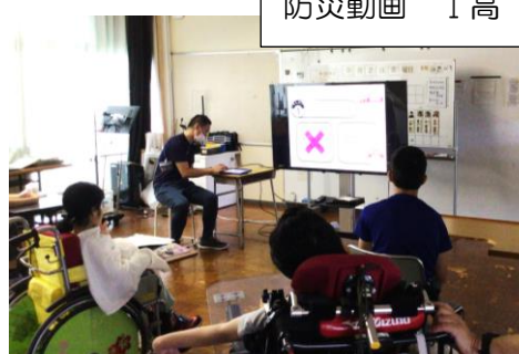
防災動画 I 高

「煙体験」のポイントは、3つ。 「目と鼻を覆う」「低い姿勢になる」 「壁をさわりながら進む」です。