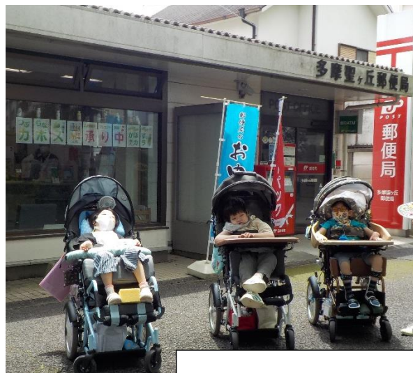
郵便局にお届け完了