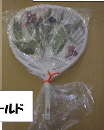
プレゼント用うちわシールド