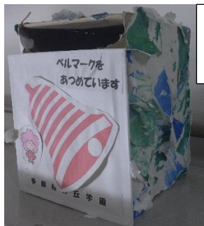
ベルマーク回収箱

指で色付けした画用紙をちぎって、箱の模様にししました。ベルマークのマークや文字を貼って、箱の完成。