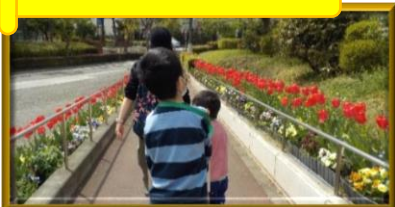
春をさがしに 校外探検

I 部門小学部 4年生です！このメンバーで学年の時間を過ごすのも4年目、もうすっかり顔なじみです。学習グループはそれぞれ分かれていますが、学年の時間に集まると楽しそうに活動する姿が見られとてもうれしいです。