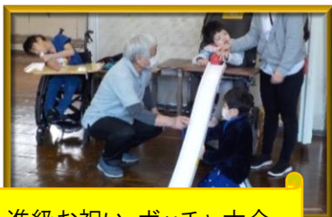
進級お祝い ポッチャ大会