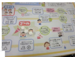
<洗濯表示すごろく>中です。「ドライってそういうことなんだ」、「乾燥機は使えないんだって」...