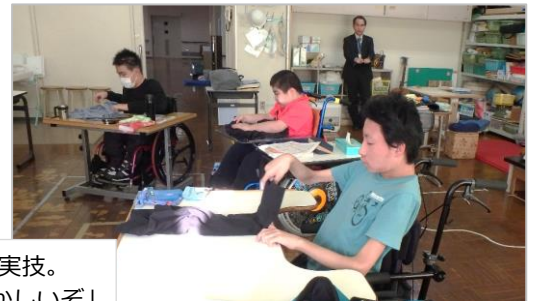
衣類のたたみ方の実技。 「なかなか、むずかしいぞ」