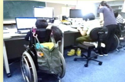
《情報の授業の様子》